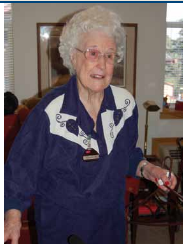
Hälsoteknik är en viktig del av Högskolans profilering och knyter samman de tre styrkeområdena – verksamhet, produkter och livskvalitet.