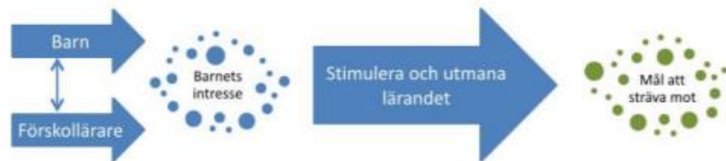
Figur 3. Barnet intresserar sig för något och stimuleras och utmanas genom lek, miljö och material samt andra barn. Förskolläraren undervisar , det vill säga, stimulerar och utmanar utifrån barnets intresse men med riktning mot de mål som förskolan ska sträva efter. Barnet ges möjlighet att utvecklas i riktning mot målen.