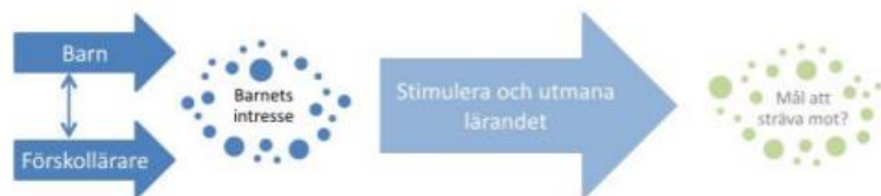
Figur 2. Barnet intresserar sig för något och stimuleras och utmanas genom lek, miljö och material samt andra barn. Förskolläraren stimulerar och utmanar lärandet generellt utifrån barnets intresse dock inte medvetet mot de mål som förskolan ska sträva efter. Det är osäkert om barnets utveckling sker i riktning mot målen.