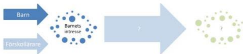
Figur 1. Barnet intresserar sig för något och stimuleras och utmanas genom lek, miljö och material samt andra barn. Förskolläraren stimulerar och utmanar inte lärandet. Det är osäkert i vilken riktning barnets utveckling går.