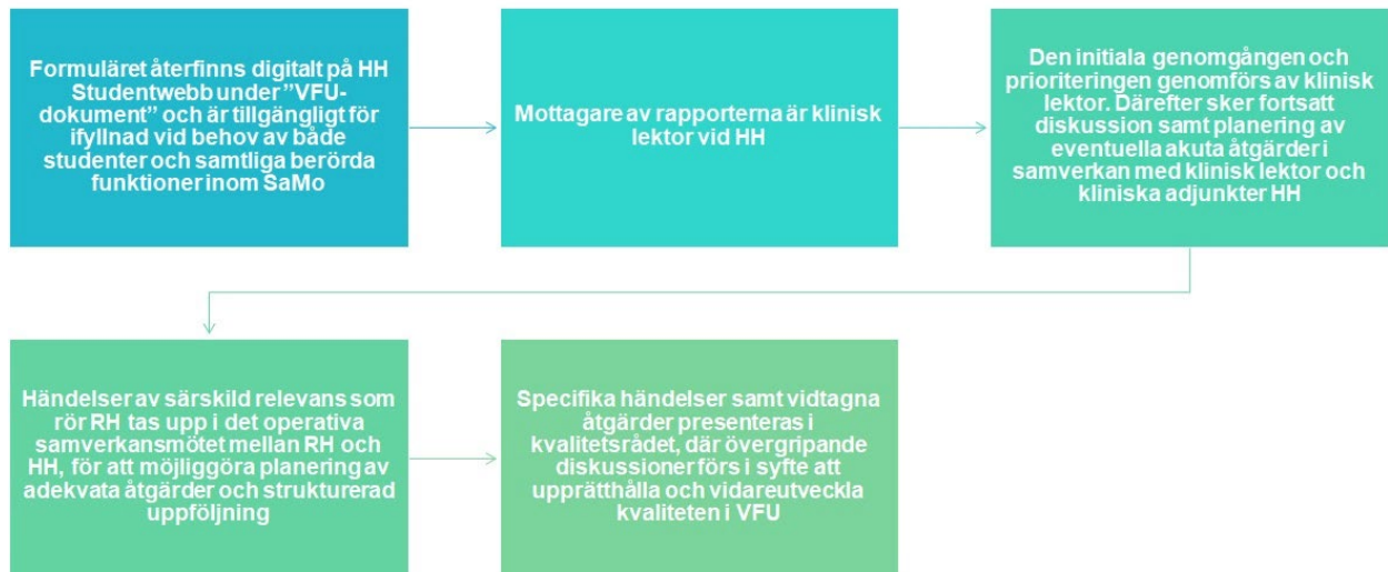
Figur 3. Processbeskrivning för hantering av specifika händelser i student- och/eller handledningssituationer inom ramen för samverkan mellan HH och RH